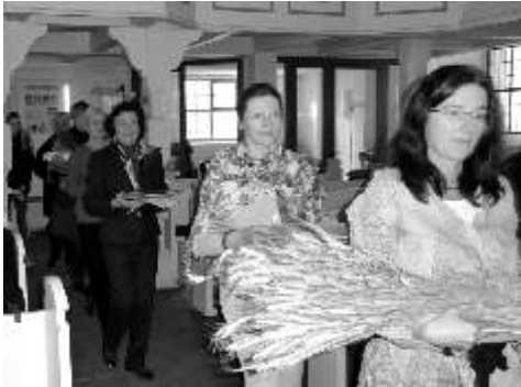
Einzug der Frauen

Nun, am 4. März hatten die Frauen unserer Gemeinde unter diesem Motto zu einem Gottesdienst anlässlich dieses Gebetstages in unsere Kirche eingeladen.