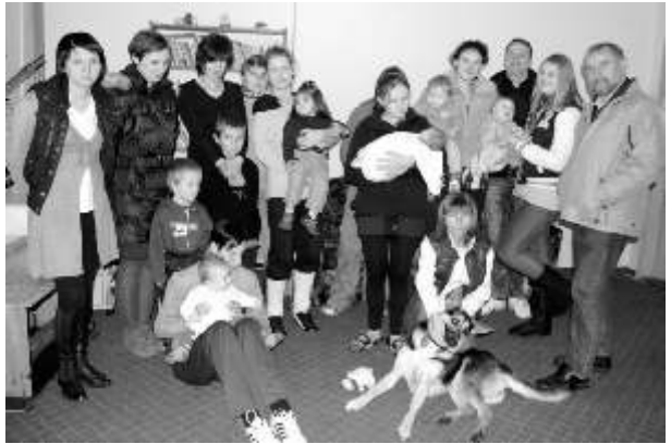
Bewohner und Besucher in Pobiedna

Ein Dach über dem Kopf, ein warmes Zimmer und genügend zu Essen, so kann einem Menschen seine Würde zurück gegeben werden. Baulich hat sich im und am Frauenhaus vieles zum Guten verändert. Ein neues Dach über Speiseraum und Küche, neue Fenster im Wohnhaus, an vielen Stellen neue Elektrik und die Küche wurde gerade neu gefliest.