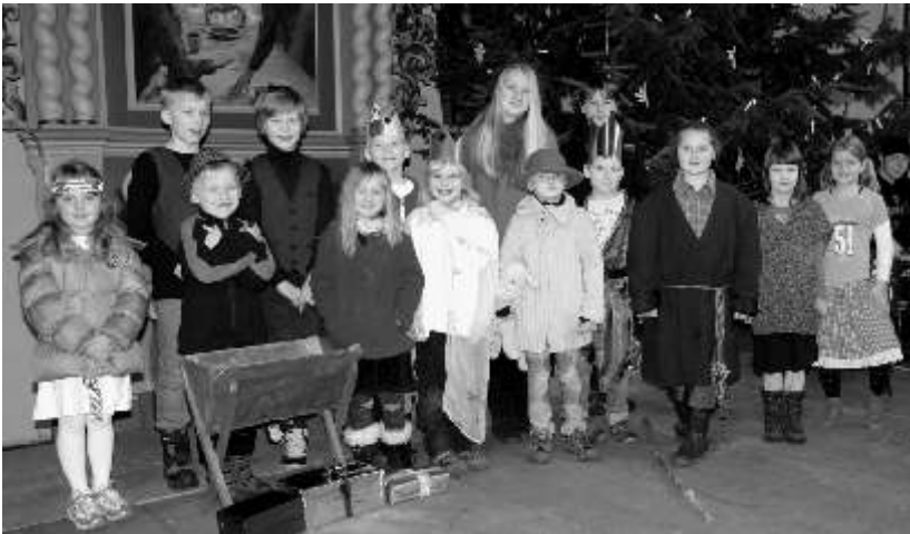
Christenlehre-Kinder bei der Aufführung um 15.00 Uhr 10