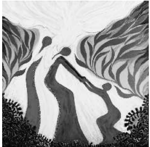
Abbildung: "Justice", Hanna Cheriyan Varghese. Bildrechte Weltgebetstag der Frauen - Deutsches Komitee e.V.

Wie lässt sich ein Staat regieren, dessen zwei Landesteile - getrennt durch das Südchinesische Meer - über 500 Kilometer auseinander liegen? Ein Land, dessen rund 27 Millionen Einwohnerinnen und Einwohner unterschiedliche ethnische, kulturelle und religiöse Wurzeln haben. Mit Kontrolle, mit Reglementierungen, mit Religion? Die Regierung des südostasiatischen Landes Malaysia versucht mit allen Mitteln, Einheit und Stabilität zu erhalten. Der Islam ist in Malaysia Staatsreligion. Immer wieder kommt es jedoch zu Benachteiligungen der religiösen Minderheiten und zu politisch-instrumentalisierten Konflikten. Malaysia könnte zauberhaft sein: Mit vielen Stränden, fruchtbaren Ebenen an den Küsten, tropischem Dschungel, Hügeln und Bergen bis 4000 Meter versucht es mit Erfolg, Touristen anzuziehen. Die Weltgebetstagsfrauen haben in ihrer Liturgie einen Weg gefunden, Ungerechtigkeiten, die "zum Himmel schreien", anzuprangern: Sie lassen die Bibel sprechen. Die harten Klagen des Propheten Habakuk schreien zu Gott. Da sind sie gut aufgehoben. Und die Geschichte von der hartnäckigen Witwe und dem korrupten Richter aus dem Lukasevangelium trifft genau den Lebenszusammenhang der Verfasser-