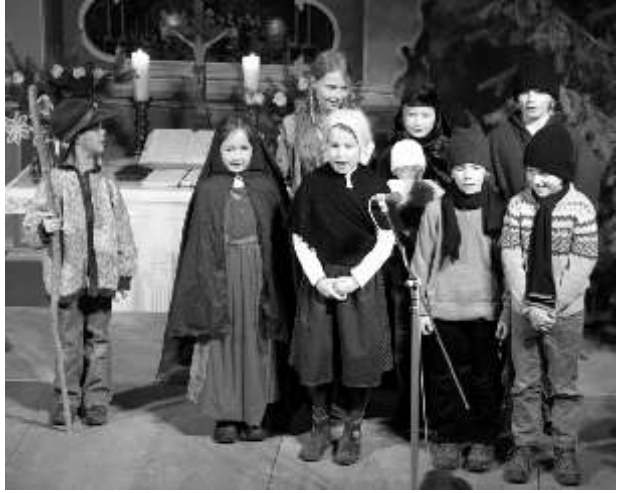
Christenlehre-Kinder bei der Aufführung um 16.30 Uhr

Diese Geschichte vom Vater Martin und die Musik dazu haben es mir angetan. Ich bin ganz glücklich, dass beide Christenlehre-Krippenspiel-Gruppen so gut mitgemacht haben. Bei der Generalprobe hatte ich doch noch viel zu meckern, aber am Heiligen Abend ging die Post ab. Es war auch nicht schlimm, wenn dann vor Aufregung, ob der vielen Leute in