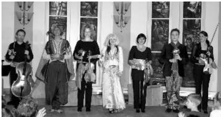
Sänger und Musiker der Lübecker Taschenoper

Die Jüngsten und auch deren Eltern erfreute am Sonnabend im Rathausaal die von der Taschenoper Lübeck kindgerecht bearbeitete Mozart-Oper "Die Entführung aus dem Serail". In diesem Singspiel durften auch die Zuschauer als Bassa