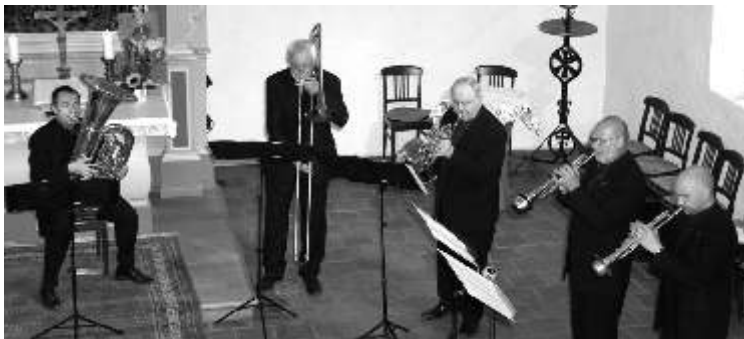
Die Potsdamer Turmbläser

Am Sonntag, den 15. Mai, fand in der Kirche das Abschlusskonzert unter dem Motto "Blech trifft Holz" statt. Bei einem musikalischen Zusammentreffen zwischen den "Potsdamer Turmbläsern" und dem bereits bekannten Saxophon-