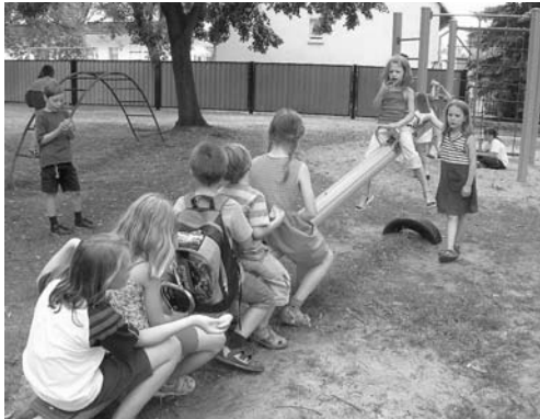
Alle für eine?!

Manchmal sieht man den Wald vor lauter Bäumen nicht... Grund genug für uns, zur Kindersommerrüste aufzubrechen. Mit 21 Kindern ging es nach Gräbendorf. Wir hörten von Baumgeschichten der Bibel, bastelten, malten, sangen, spielten, tobten und feierten. Wir verließen uns auf langen Wanderungen und fanden uns wieder. Probierten aus, mit geschlossenen